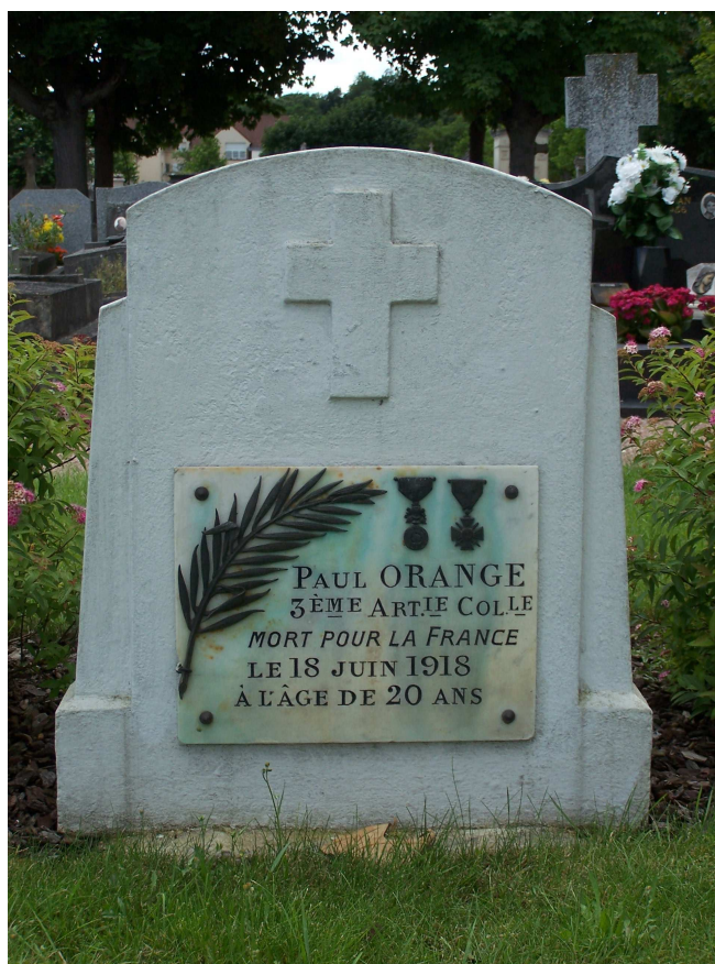
Sépulture A 19