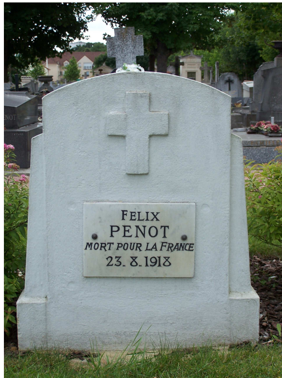
Sépulture A 18