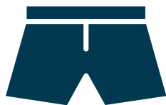
Boxer de bain