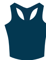
Lycra en extérieur