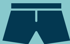
Boxer de bain