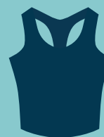
Lycra en extérieur