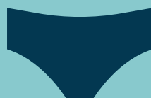
Slip de bain