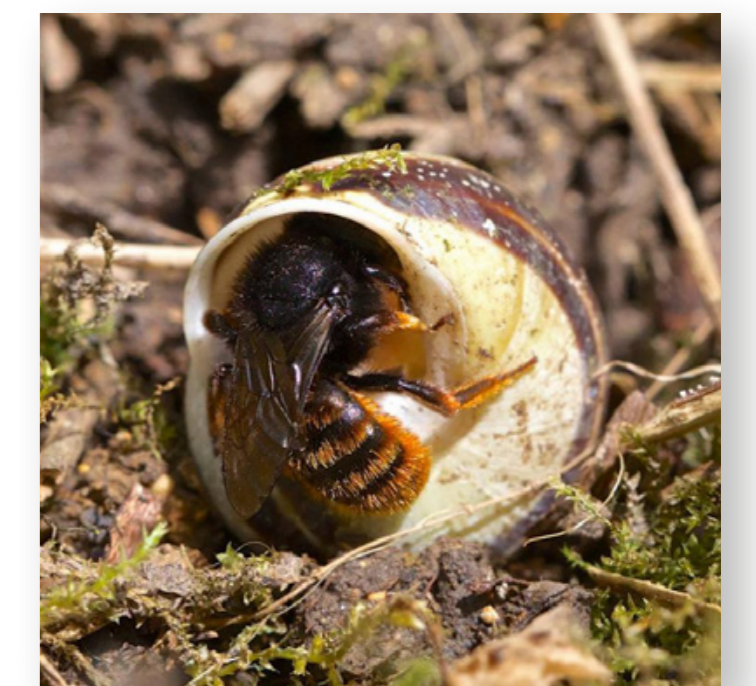
Osmia bicolor est une squatteuse de coquille vide d'escargot afin d'y faire son nid.