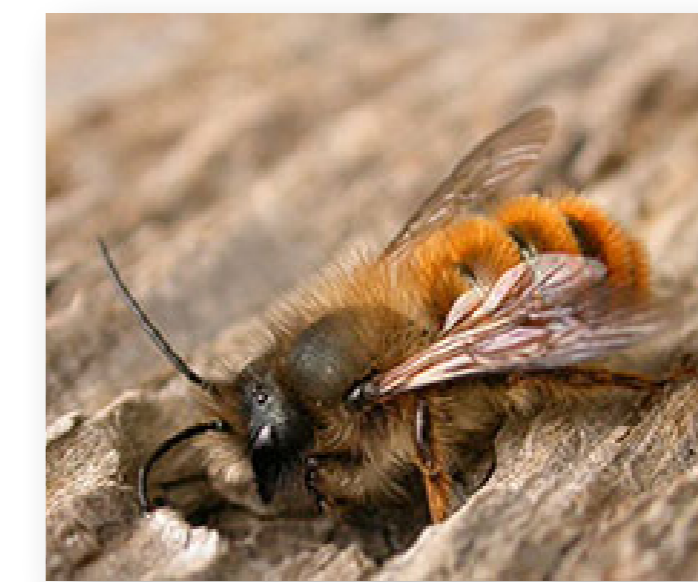
L'une des abeilles sauvages d'Europe les plus courantes : Osmia rufa .

Les espèces dites terricoles (qui vivent dans la terre) représentent 80% des abeilles sauvages. Les espèces maçonnes (Mégachiles) préfèrent bâtir leur nid dans des vieux murs et les xylocoles choisissent du bois mort ou des tiges de bambou.