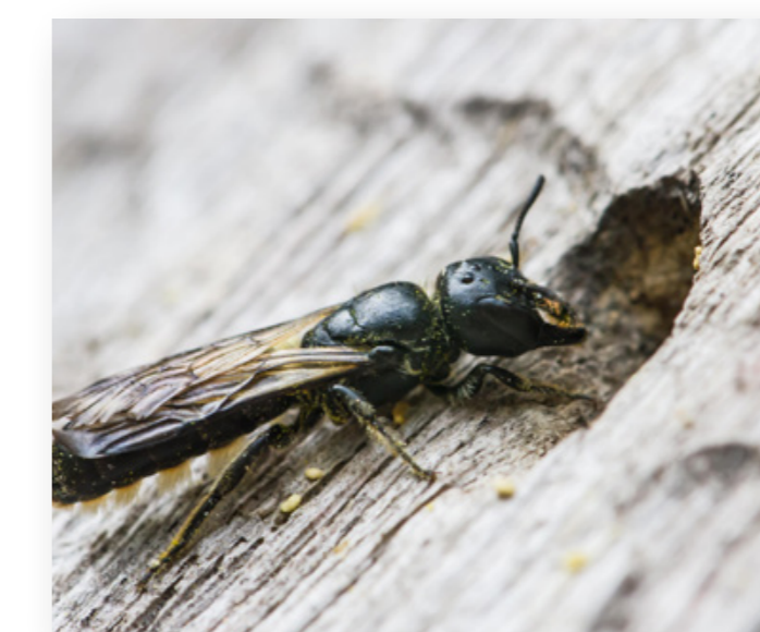
Chelostoma florissomme construit souvent son nid dans des tiges creuses.