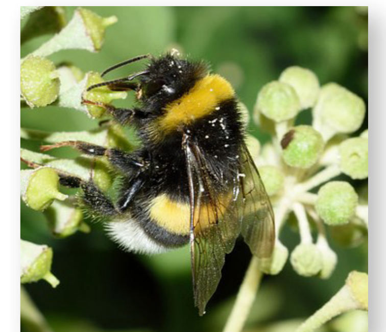
Le Bombus terrestris est le plus commun des bourdons. Il est élevé comme pollinisateur et s'avère particulièrement efficace car il peut travailler par temps froid.